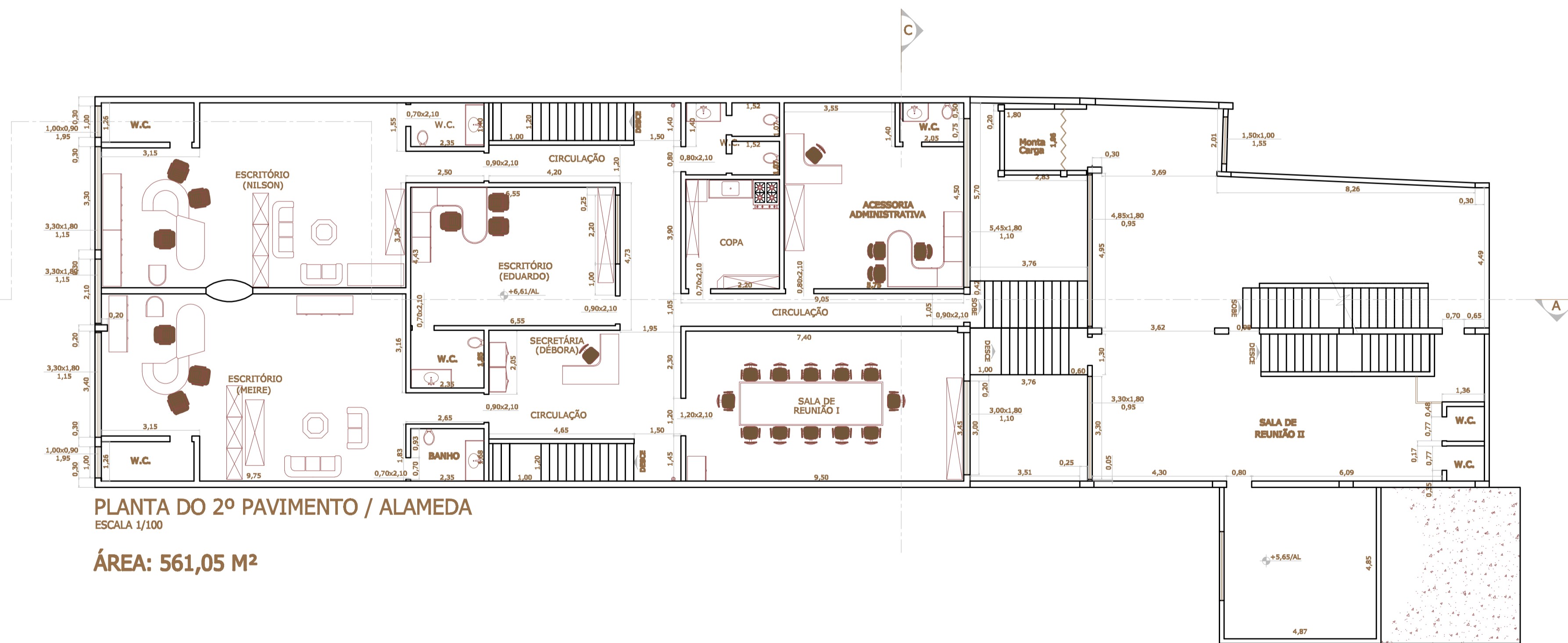
PLANTA DO 2º PAVIMENTO / ALAMEDA ESCALA 1/100